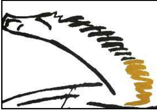
التحليل البنائي :