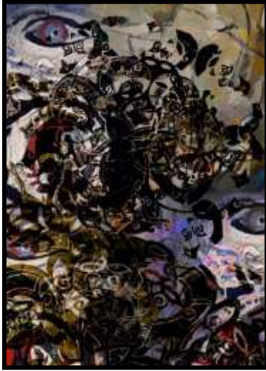
المعلق رقم (4)