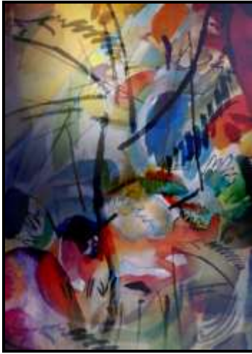
المعلق رقم (6)