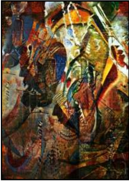
المعلق رقم (2)

ويمكن توظيف المعلق رقم (1) والمعلق رقم (2) في منزل واحد